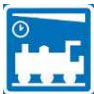
Rautatieasema Железнодорожная станция