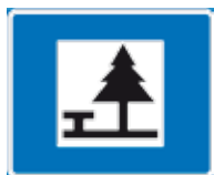
Levähdysalue Место отдыха (Без обслуживания)