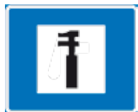
Autokorjaamo Техническое обслуживание автомобилей