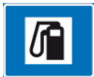
Huoltoasema Автозаправочная станция