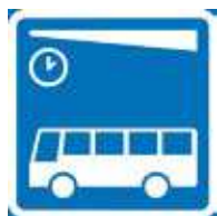
Linja-autoasema Автобусная станция

Профессиональная лексика по вопросам приграничных перевозок (словарь Loggy): http://glossary.fi/index.php?a=list&d=19&p=1